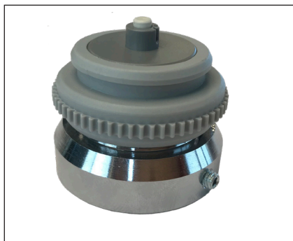
Adapter til telestat, VA72

VÆLG den ventil der passer til projektet.