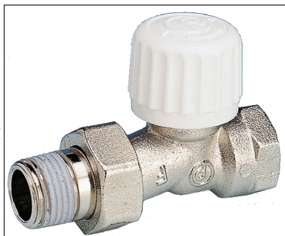
Radiatorventil LL, 1/2"