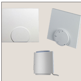
Trådløs, analog løsning

VÆLG den styringspakke der passer til projektet. Vælg mellem en trådløs eller fortrådet løsning, med analog eller digital rumtermostat.