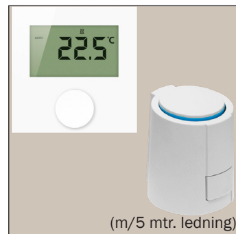
Fortrådet, digital løsning