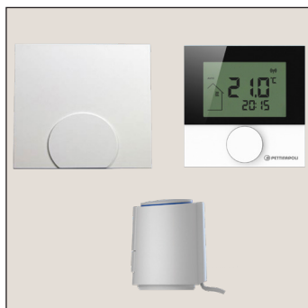
Trådløs, digital løsning