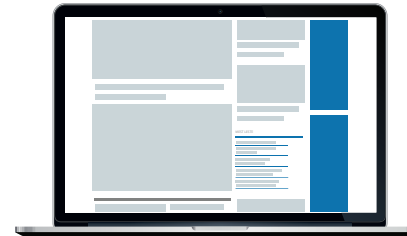
Sky 1, 2

Format: B: 180 px x H: 500 px Mobilformat: B: 468 px x H: 150 px Størrelse: max. 90 kB