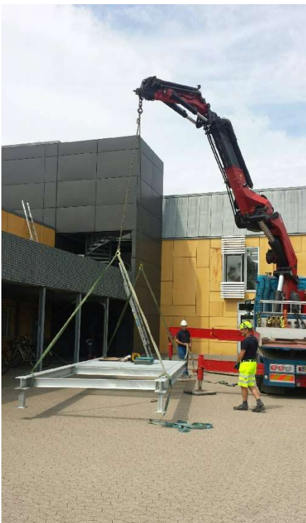
Billede 3: Fremstilling og montering af stålramme - Retten Helsingør.