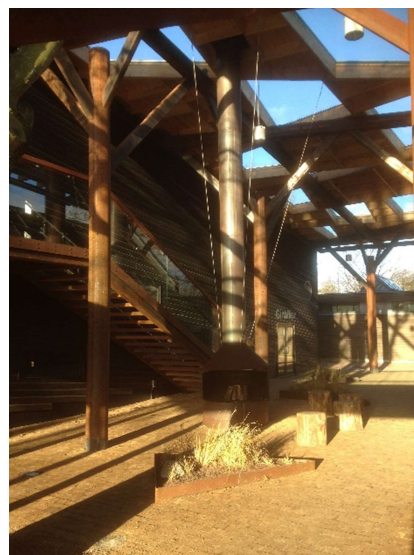
Billede 11: Smedearbejde i cortenstål - Københavns Zoo Frederiksberg.