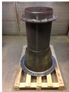
Billede 5: Offshore komponent.