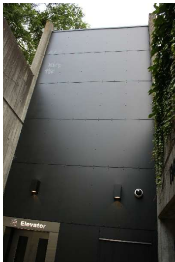
Billede 10: Rustfri og sort facadebeklædning - Birkerød Station.