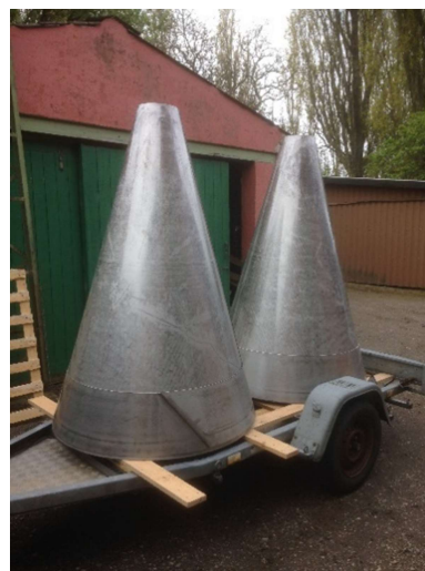
Billede 8: Valsning af rustfrie kegler - Novo Nordisk.