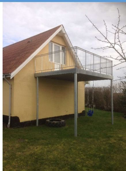
Billede 7: Altan galvaniseret - Privat kunde.

Se mere smedearbejde på https://hnielssons.dk/smedearbejde/