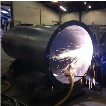
Billede 1: Valsning og svejsning af trykbeholder.