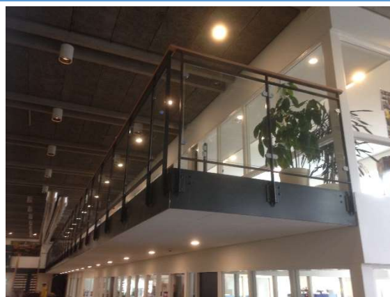
Billede 6: Balkon med glasværn - Hardi International Nørre Alslev.