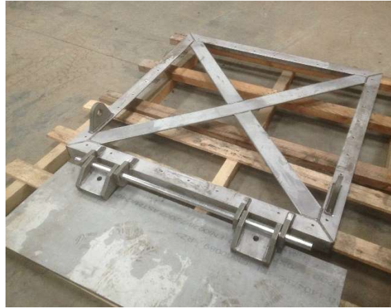
Billede 2: Rustfri stålramme gods tykkelse 10/20 mm - Vennerslund Gods.