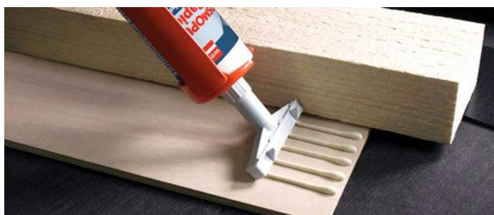
Ved indvendige kanter skær man simpelthen bare den sidemonterede føringsliste af.

Lim-Tech ApS Industrivej 5. - 7120 Vejle – Danmark Tlf.: +45 75 711977 Fax: +45 75 712877 V.A.T. / Ust-IdNr. DK13279470 Mail: Info@Lim-Tech.dk WWW.Lim-Tech.dk