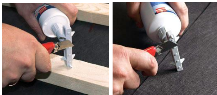
Ved individuelle udskæring af huller i påføringsåbningerne kan påføringsbredden nemt justeres til den aktuelle opgave.