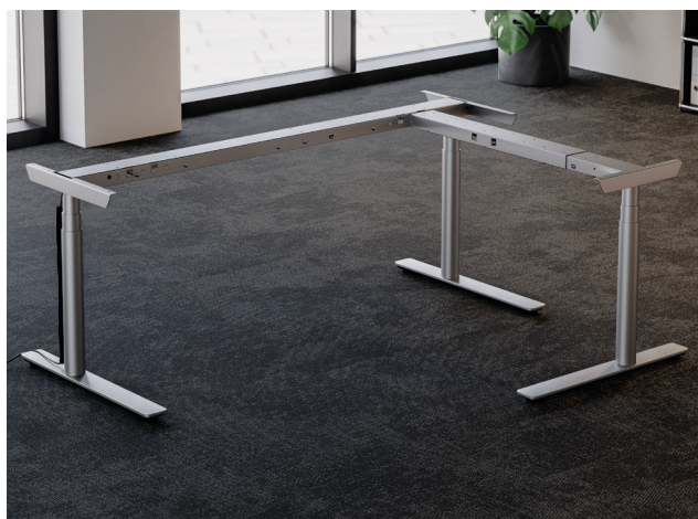
Ecklösung TE601 Work Style.