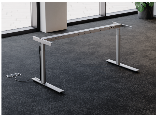
Tischgestell TE601 Work Style.

Bringen Sie mit der neuen Style Variante des TE601 Work Schreibtischgestells Eleganz ins Büro. Die Designer-Kufe und die farbgleichen Gleiter sorgen für ein schwebenden Effekt und ein harmonisches Gesamtbild. Mit dem Drehknopf und der 3-fach Memory Funktion ist die bevorzugte Arbeitshöhe immer parat. Entdecken Sie die stilvolle Art, den Arbeitsplatz zu gestalten.