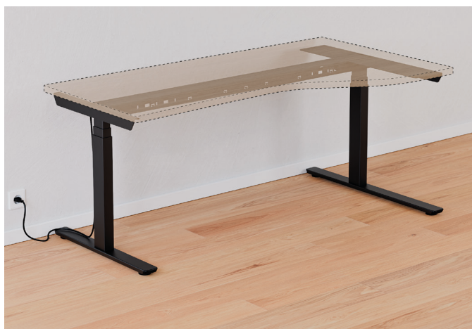
Tischgestell Classic Ecklösung kurz.

Entdecken Sie die neue Ecklösung für das Classic Schreibtischgestell und erweitern Sie so die Arbeitsfläche. Die variabel verstellbare Zarge kann einfach justiert und stabil an der Tischplatte befestigt werden. Ob für zu Hause oder im Büro – passen Sie Ihr Schreibtischgestell individuell an die Bedürfnisse an. Entdecken Sie jetzt die Flexibilität des TE601 Work Schreibtischgestells.