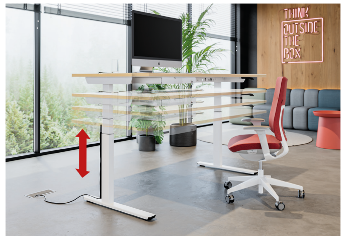
Höhenverstellung mit Kollisionserkennung.