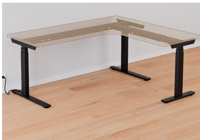
Tischgestell Classic Ecklösung lang.