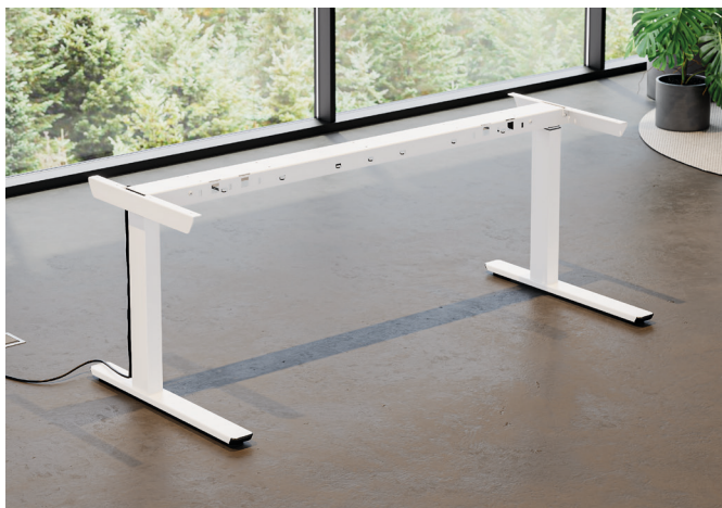
Tischgestell TE601 Work.

Das elektrisch höhenverstellbare Schreibtischgestell TE601 Work bietet höchste Beweglichkeit und Sicherheit mit einer Höhenverstellung zwischen 60 cm und 125 cm und einer Tragkraft von 120 kg. Es verfügt über eine sensible Kollisionserkennung, eine überdurchschnittliche Säulengeschwindigkeit und ein schlankes Design. Die Memory- und Erinnerungsfunktion des Bedienelements ist im Standard enthalten. Mit neuen Ecklösungen und verschiedenen Größen ist das TE601 Work die perfekte Wahl für jeden Arbeitsplatz.