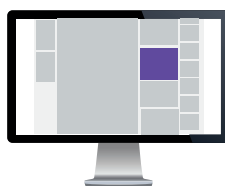
Kampanjebanner – Artikkel Str. 300x250 pixels