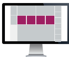
Innholdsbanner – Forsiden Str. 230x230 pixels