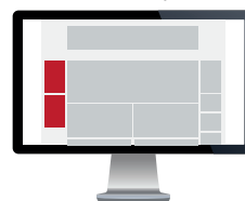
Sticky Banner Str. 240x400 pixels