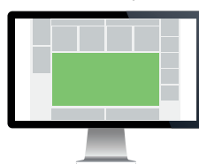
Gigabanner – Forsiden Str. 980x480 pixels