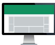
Toppbanner Full Size Str. 1800x450 pixels