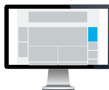
Hjørnesidebanner Str. 200x300 pixels