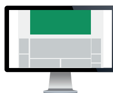
Billboard Str. 980x540 pixels