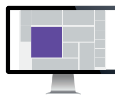
Kampanjebanner – Forsiden Str. 480x480 pixels