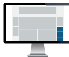
Sidebanner Str. 200x175 pixels