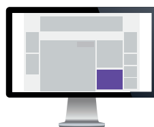
Kampanjebanner – Artikkel Str. 300x250 pixels