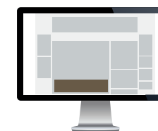
Artikkelbanner – Artikkel Str. 660x200 pixels