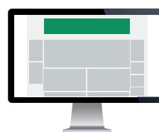
Toppbanner Str. 930x180 pixels