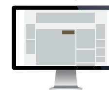
Tittelbanner – Artikkel Str. 300x60 pixels