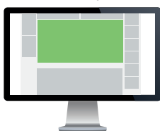
Gigabanner – Forsiden Str. 980x480 pixels