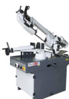
Bånd- og rundsav