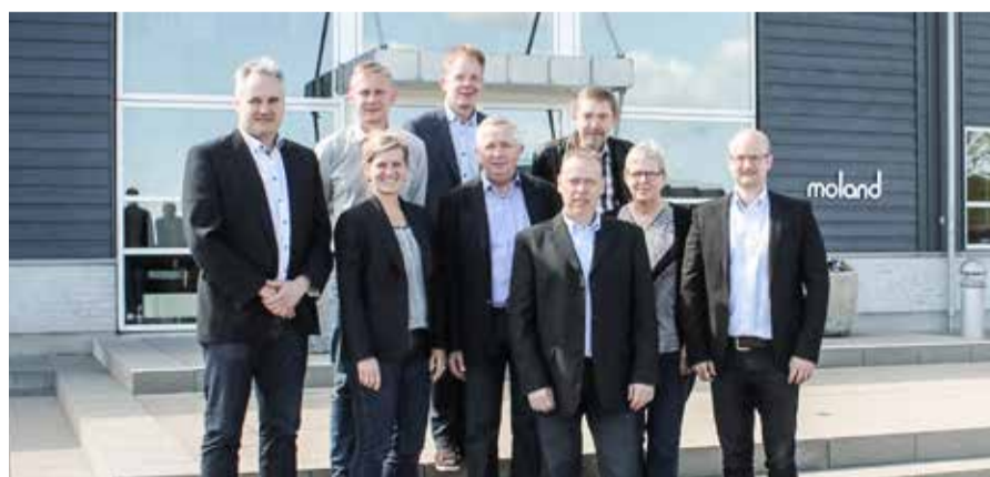
Det stærke hold fra Moland Byggevarer står klar til at servicere danske kunder med kompetent rådgivning om Ceresits mange produkter.