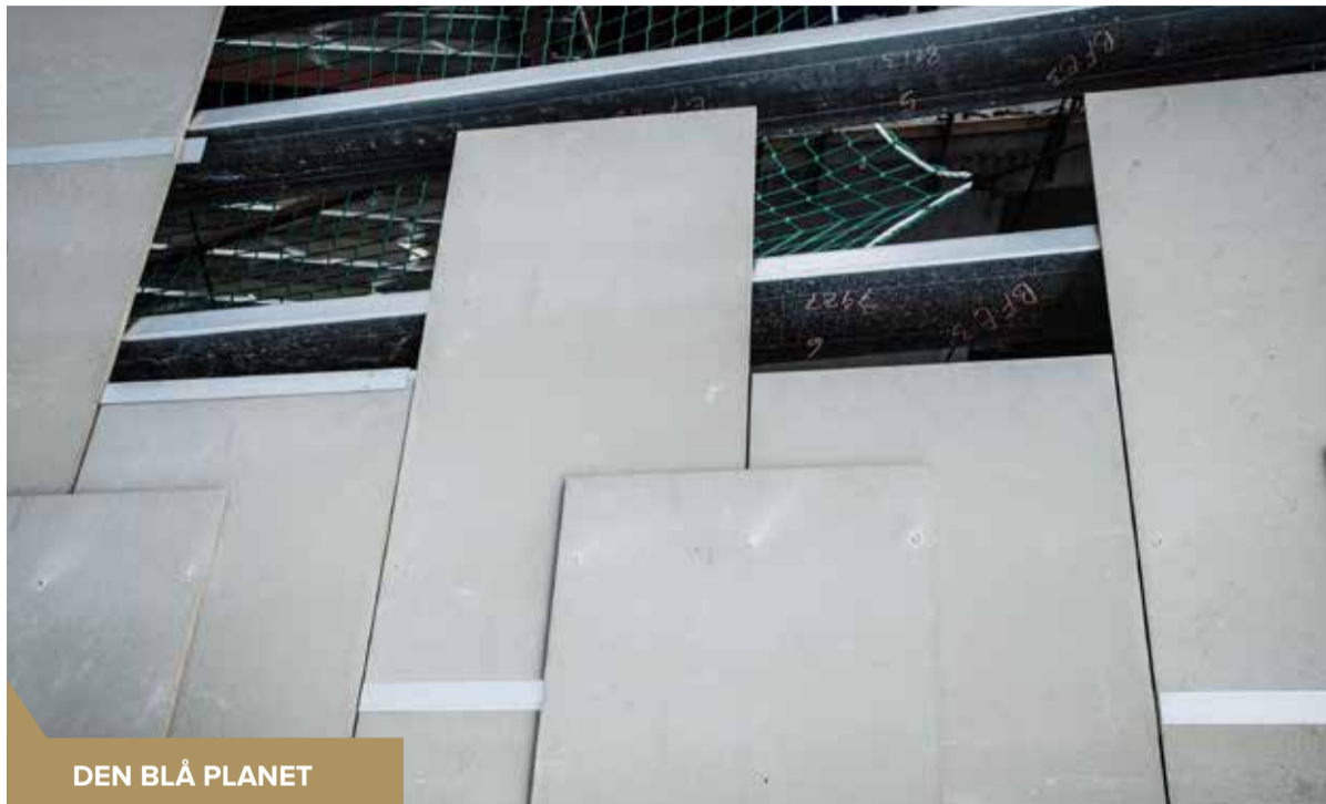
DEN BLÅ PLANET