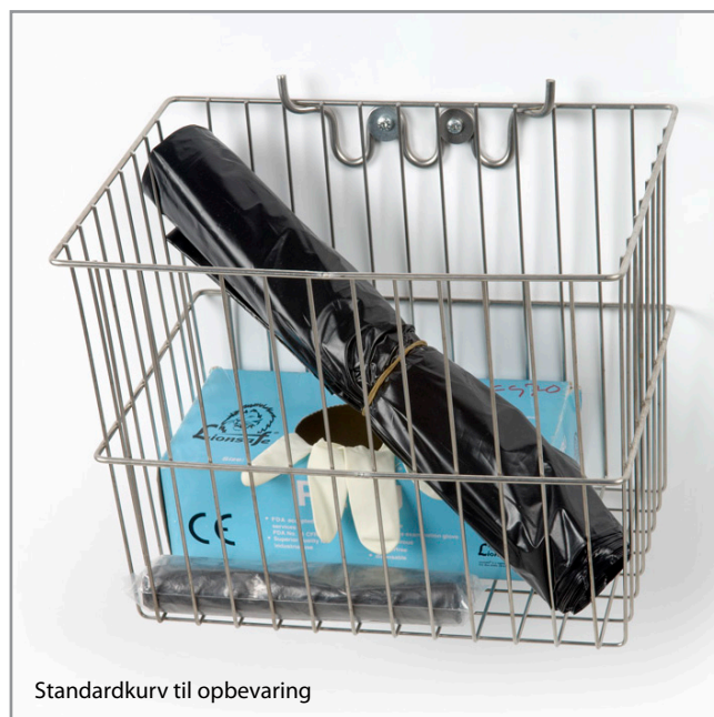
Standardkurv til opbevaring