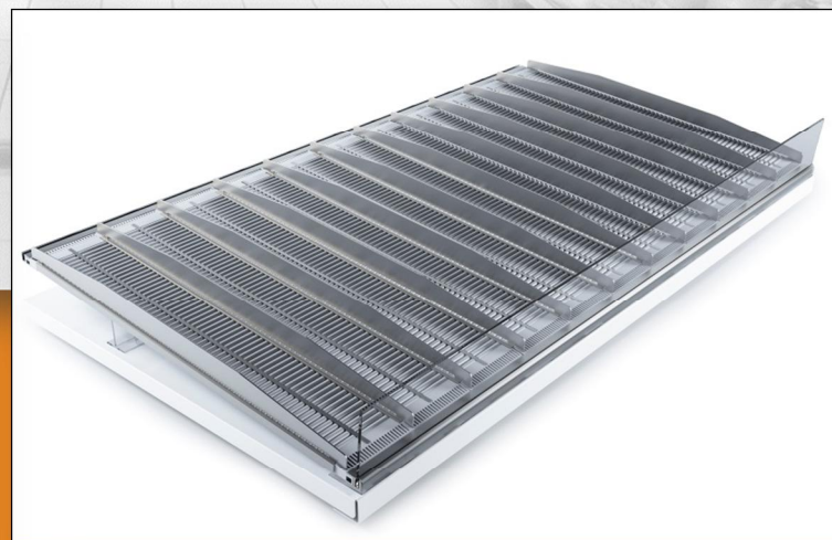
RollerTrack ark med afdelere, frontliste samt vinkel adapter