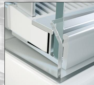
Frontstop m. tape