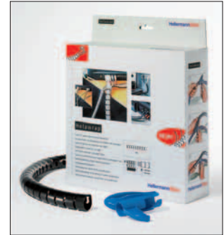
Helawrap er den hurtige og enkle løsning på kabelkaos. Den findes i 2 størrelser og 3 farver.