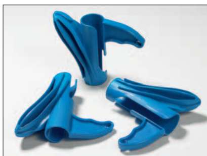
HAT monteringsværktøj passer til alle Helawrap størrelser.

Hellawrap værktøjet HAT sikrer hurtig og let installation af ledninger, kabler og slanger. Værktøjet lægger kablet ned i spiralslangen og sikre samtidig at ledninger kan udgrenes. Samtidig kan kabler og ledninger indsættes i spiralbindingen på ethvert sted.