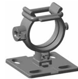
For ekstra sikkerhed kan R1 elastik benyttes.