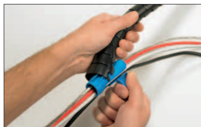
Placer værktøjet i en af enderne af slangen.