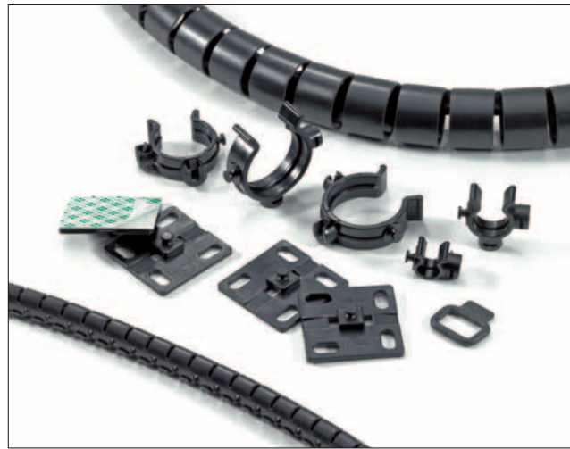
Helawrap tilbehør til bundtning, fastgørelse og beskyttelse af kabler og ledninger.