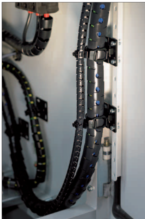
Med Helawrap tilbehørsæt kan kablerne bundtes, beskyttes og fastgøres på el-skabe i industrianlæg.

Alle dimensioner i mm. Der tages forbehold for eventuelle ændringer.