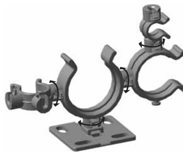
Multifleksible klips der kan drejes frit.

Helawrap holdere og monteringsplader kan sættes sammen således at de kan bundte, beskytte og fastgøre slanger på maskiner. De kan også benyttes i tavler, specielt i overgangen mellem væg og dør. Helawrap tilbehør benyttes også til at få orden på kablerne i hjemmet eller på kontoret.