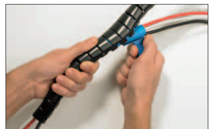
Træk simpelt værktøjet gennem Helawrap beskyttelsen.