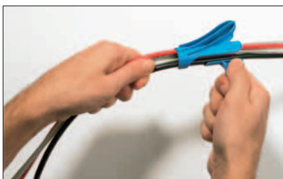
Læg en eller flere kabler i montageværktøjet.

Alle dimensioner i mm. Der tages forbehold for eventuelle ændringer.