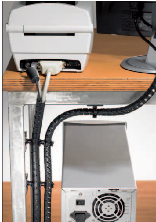
Der findes forskellige farver således at kabelbeskyttelsen kan tilpasses hjem og kontormiljø.

Den praktiske Helawrap i 2 meters længde er velegnet til husholdnings- og kontoropgaver.