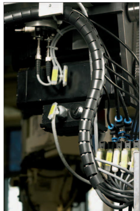
Bedre og mere effektiv kabelbeskyttelse med mulighed for afgrening over hele beskyttelsen.