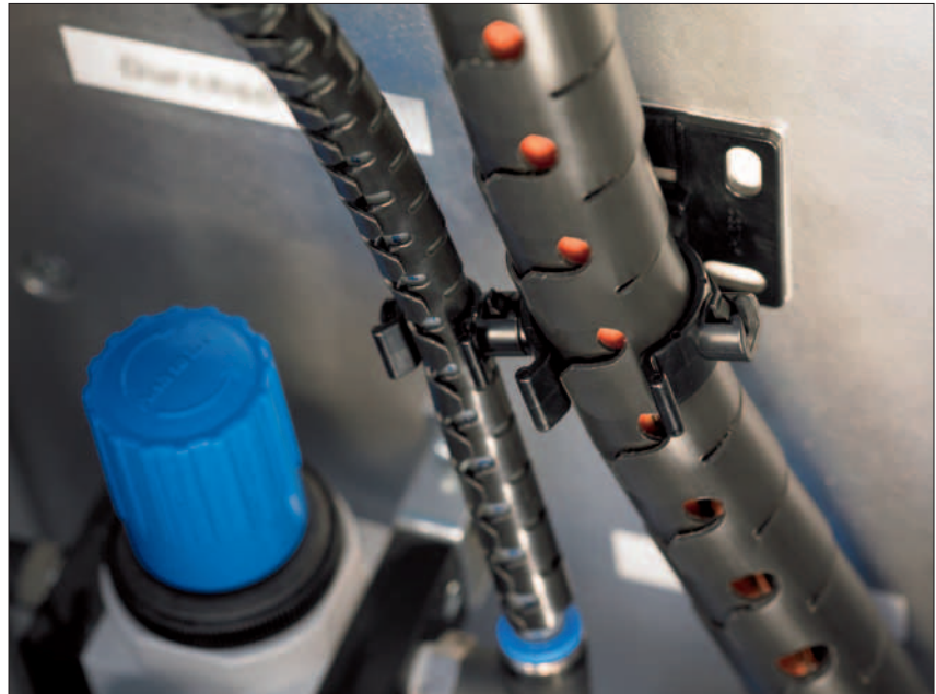
Helawrap er en god løsning til beskyttelse af kabler mod mekanisk slidtage.

Helawrap benyttes til at bundte og beskytte kabler indenfor den elektriske industri såsom tavler, maskinproduktion og bilindustrien, hvor bevægelser og vibrationer forekommer. Helawrap findes også i 2 meters længder til mindre opgaver. På grund af sin udmærkede flammebeskyttelse er Helawrap HWPA-V0 det perfekte produktvalg til steder, hvor brandbeskyttelse er af stor vigtighed, f.eks. i den kollektive trafik.