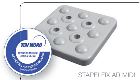
STAPELFIX AR MIDI