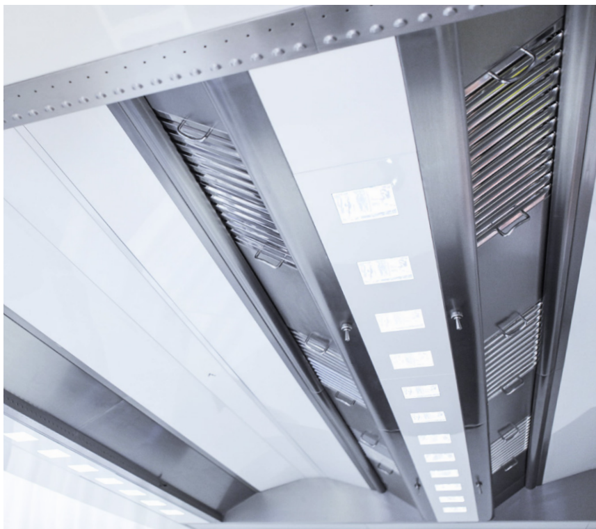
Udsugningskamre med kurver

CAPTURE JET™ OG CAPTURE RAY™ KØKKENVENTILATIONSLOFT Nyt design med Haltons Kulinariske Lys (HCL) og lavimpulserstatningsluft