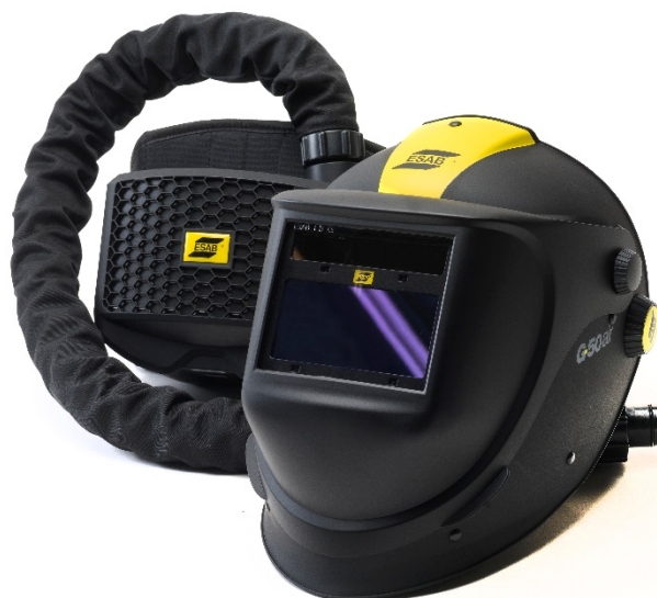
G50 Air with ESAB PAPP