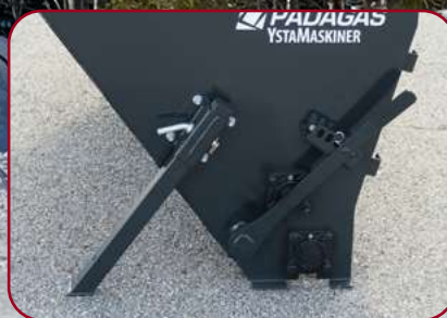
Stödben och reglering av utmatning