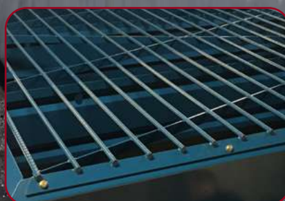
Galler som förhindrar klumpar vid påfyllning