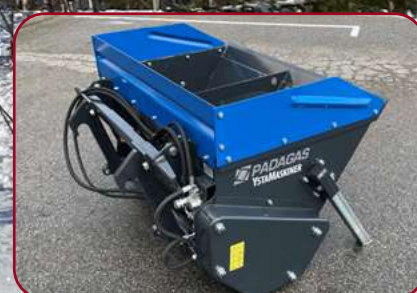
Förhöjningssidor SP 600