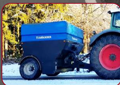
Blästrad och pulverlackerad