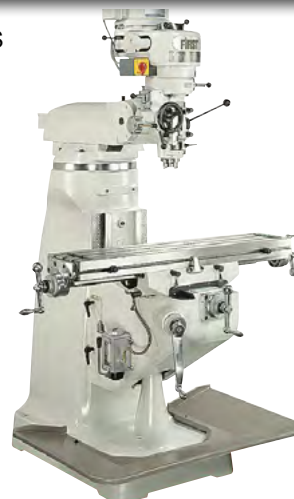
LC-1 1/2 VS