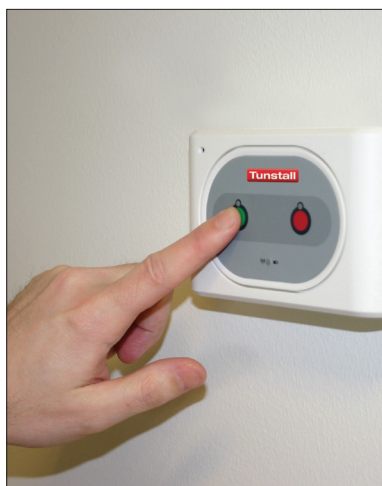
Her ses en af de trådløse enheder, som sættes op i den enkelte bolig.