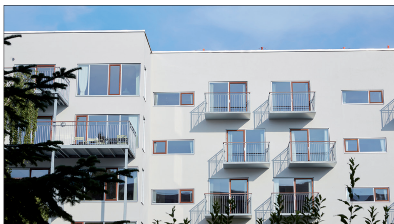
Holteprojekt Bygherrerådgivning A/S har været bygherrerådgiver på renoveringen af Hørgården.