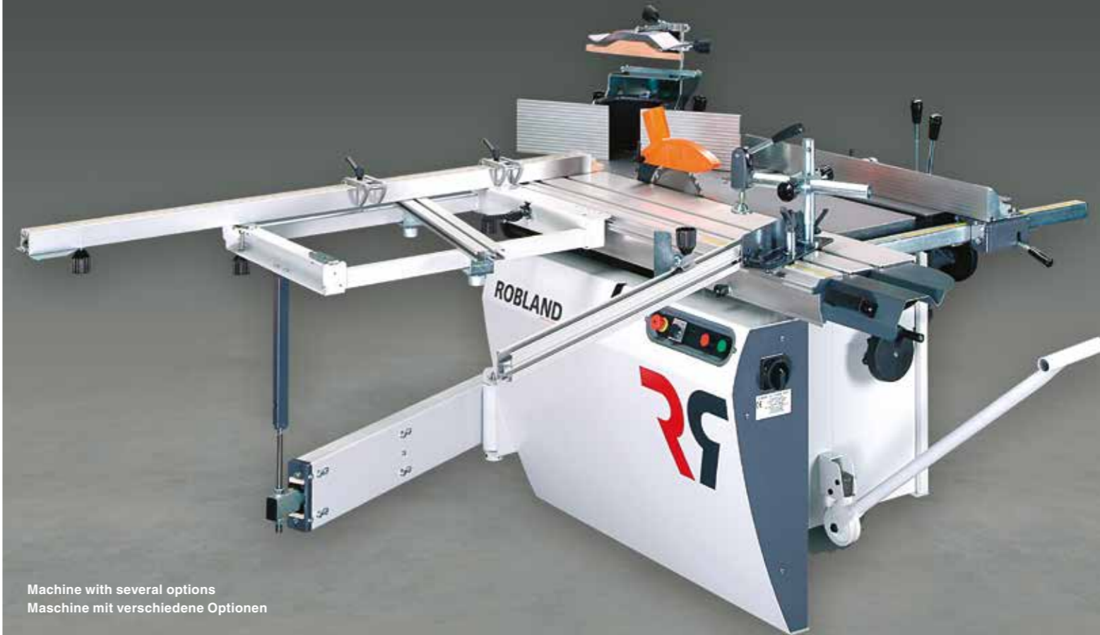
Machine with several options Maschine mit verschiedene Optionen

Der quertisch auf Teleskoparm ist ausgestattet mit einer schwerausgef"hrten stabilen Queranschlag mit 2 Wegklapbare Anschläge. Dies ermöglicht Ihnen die Bearbeitung grosser Werkstücke.