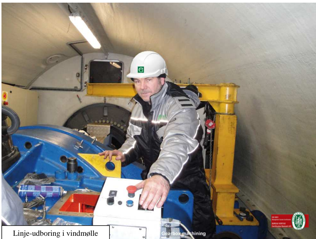
Linje-udboring i vindmølle