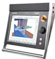
Delem DA-69T 3D Windows