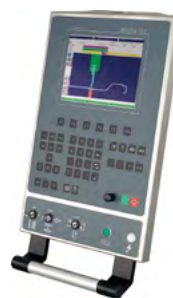
ModEva 10 2D Windows