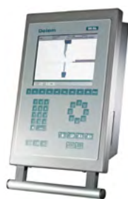
Delem DA-56 2D Windows