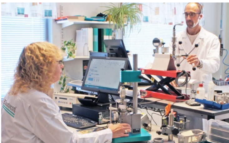
Det allmänna laboratoriet för kalibrering vid 23 °C. Utöver detta har vi ett konstant- rum för kalibrering av längd vid 20 °C ± 0,5 °C, samt ett rum för temperatur- kalibrering.

Mätosäkerheten är den osäkerhet i kalibreringsresultatet som finns efter kalibreringen. Mätosäkerheten beräknas för varje mätsituation. I osäkerheten ingår bl a normalens noggrannhet, det kalibrerade instrumentets upplösning, samt omgivande faktorer som temperatur mm.