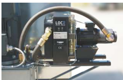
Optional: Ölkühlung für Hydraulikaggregat