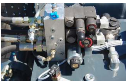
Sensor für Öltemperatur Optional: Ölmangelschalter