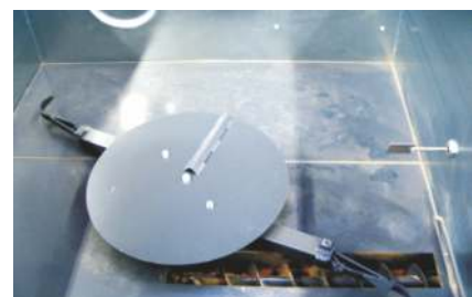
Robustes Rührwerk, Austragarme mit Federmechanismus, Schneckenvorverdichtung