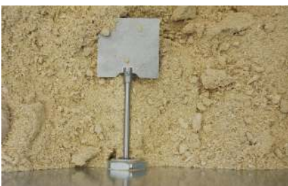
Optional: Füllstandsmelder für automatischen Start der Maschine