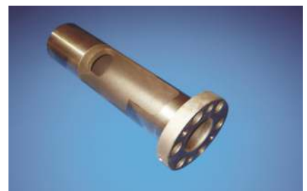
Auswechselbare durchgängig gehärtete Preßraum Verschleißbuchse