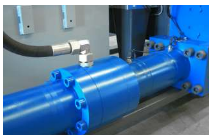
Starke Verpressung durch großzügig dimensionierte Zylinder