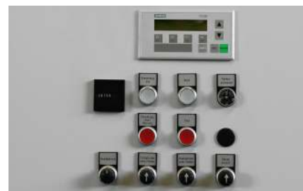
Übersichtliche Bedienung mit Handfunktionen. Optional mit Klartextdisplay