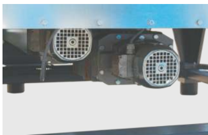
Starke Getriebemotoren für Schnecken vorverdichtung und Rührwerk