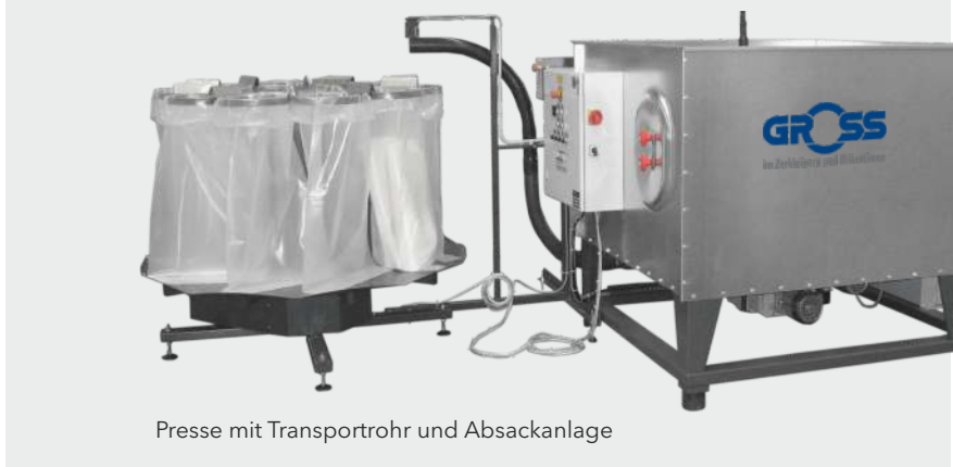
Presse mit Transportrohr und Absackanlage