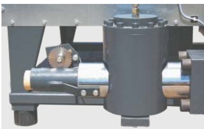
Stranglängenüberwachung zur automatischen Brikettierlängenregulierung