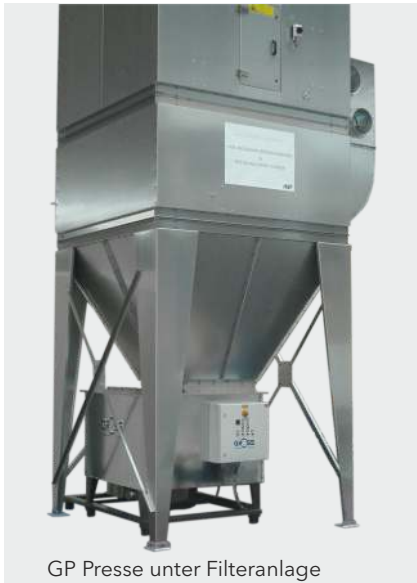
GP Presse unter Filteranlage