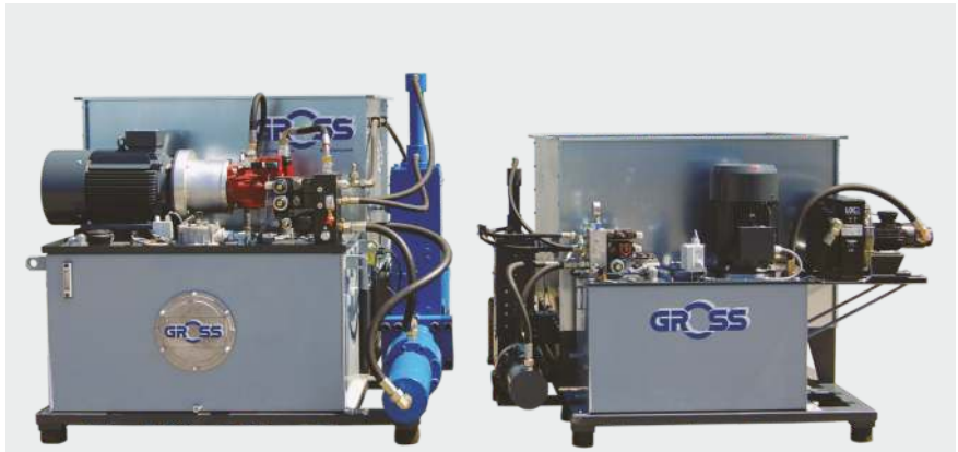
Rechts- und Linksausführung der Presseneinheit

Brikettierpressen der GP Serie sind besonders robust und werden allen Anwendungen beim Brikettieren von z. B. Holzspänen, Hackschnitzeln, Papier, Kartonagen, Styropor, verschiedenste Stäuben und vielen anderen homogenen Materialien gerecht. Darüber hinaus sind sie einfach in der Wartung und überzeugen durch niedrige Betriebskosten. Die GP Serie ist deshalb die erste Wahl für die Holzverarbeitende Industrie.