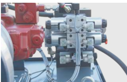
Solide Ventil und Pumpentechnik