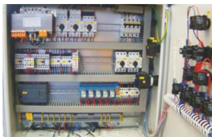
Schaltschrank / SPS Steuerung