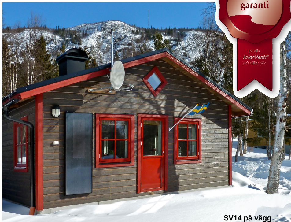
SV14 på vägg

Alla modeller är slimline SV3, SV7, SV14 och SV20: