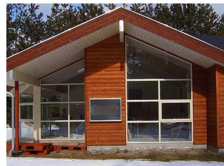
SV7 på vägg

Solpanelen kan monteras direkt på väggen eller på taket med vår speciella takmonteringssats. Luften leds direkt in i huset med ett specialanpassat alu-flexrör och avslutas med ett reglerbart vitt luftdon.