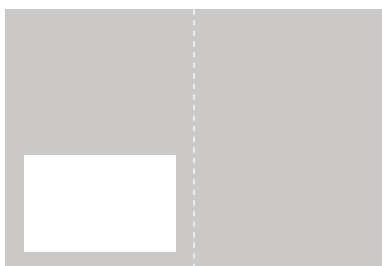
1/2 sida 35 000:- Satsyta: 185 x 123 mm