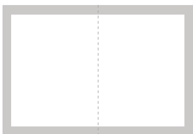
Uppslag 63 000:- 430 x 285 mm + 5 mm utfall