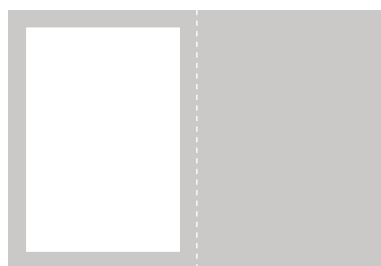
1/1 sida 44 500:- Utfallande: 215 x 285 mm + 5mm