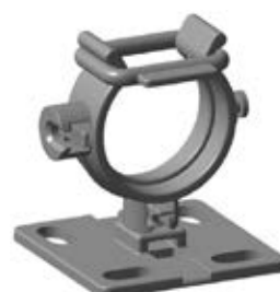
For ekstra sikkerhed kan R1 elastik benyttes.