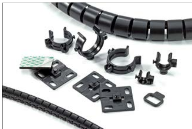
Helawrap tilbehør til bundtning, fastgørelse og beskyttelse af kabler og ledninger.