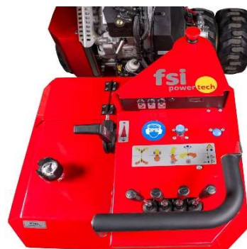
Betjeningspanel - svingbart