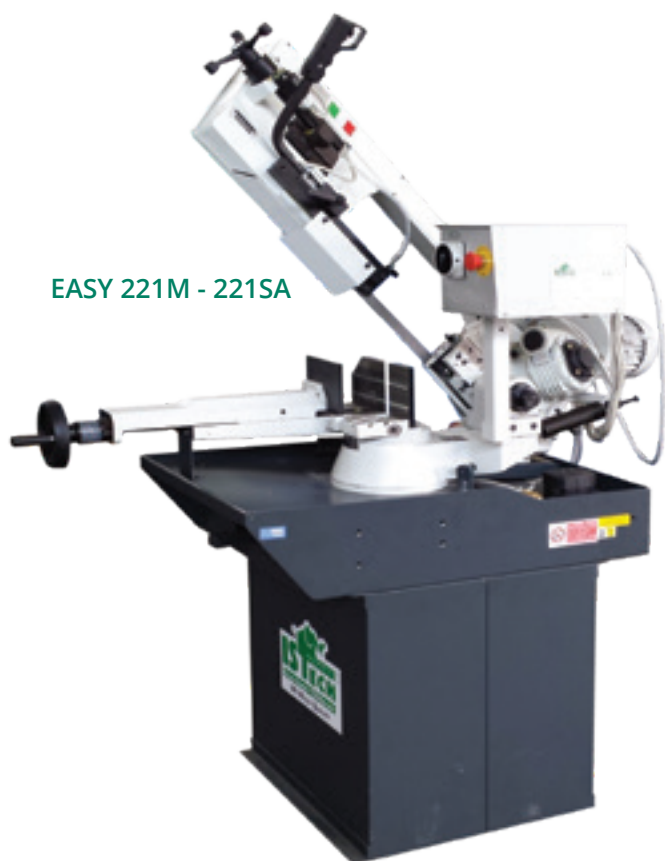
EASY 221M - 221SA

Manual Semiautomatic - Manuelle Semi-automatique