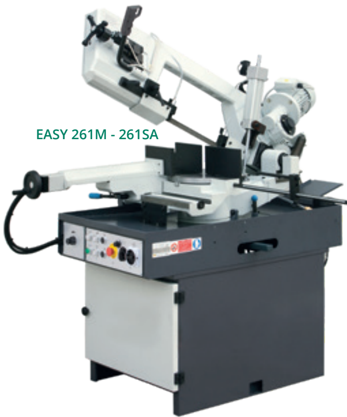
EASY 261M - 261SA

Manual Semiautomatic - Manuelle Semi-automatique