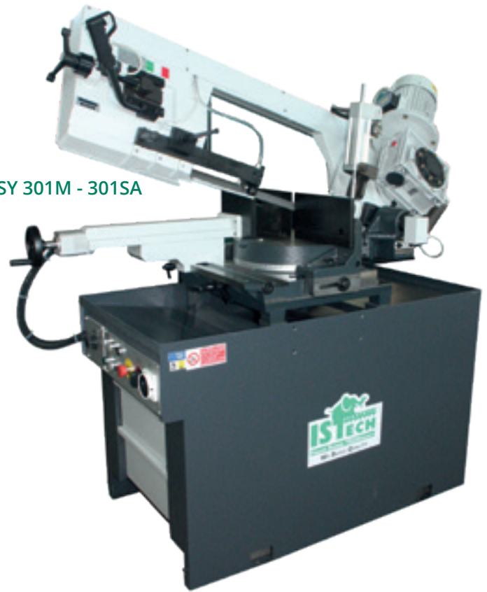
EASY 301M - 301SA