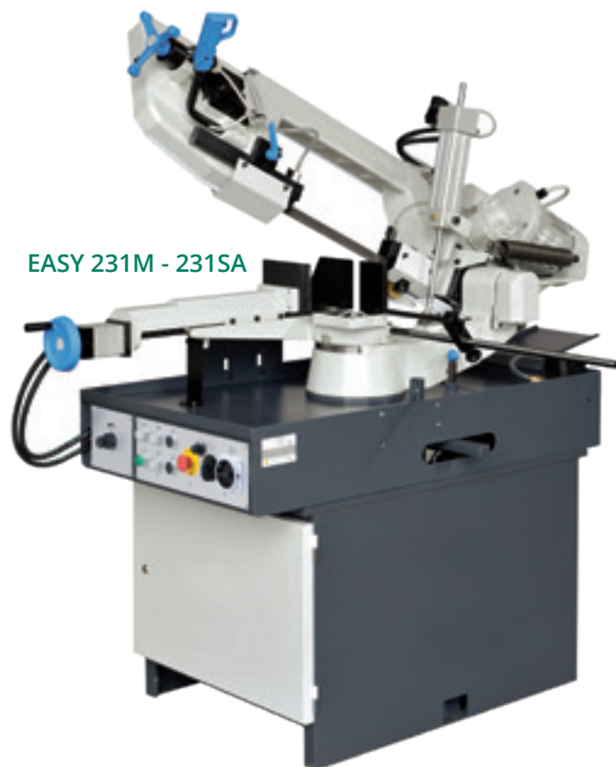
EASY 231M - 231SA