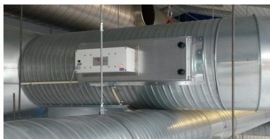
Her med monterings kid tilpasset Ø600