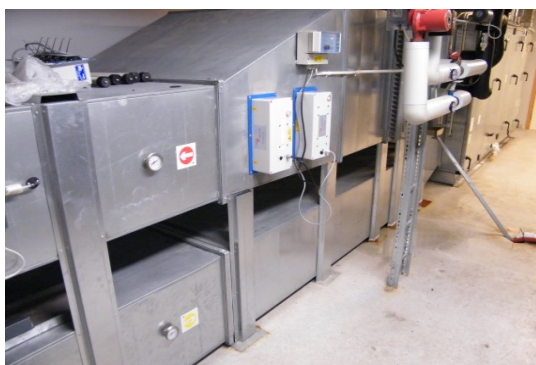
Direkte ind i ventilationen