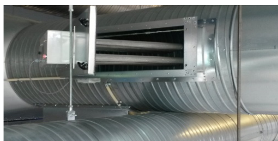
Her med monterings kid tilpasset Ø600