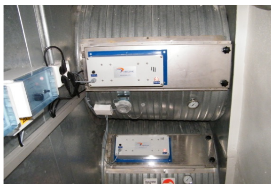
Her med monterings kid tilpasset Ø600