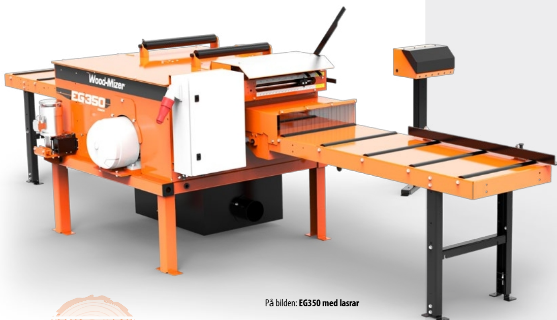
På bilden: EG350 med lasrar

Upp till fem knivar kan monteras på en speciell hylsa med distanser som justerar bredden på slutprodukten. Bladdistanserna finns i olika bredder och kan anpassas på begäran.