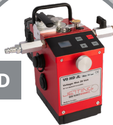
V0 / V0 HD