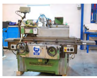
Kellenberg rundsliber Type 600R Sony digital udstyr Pris DKK 48.000,-