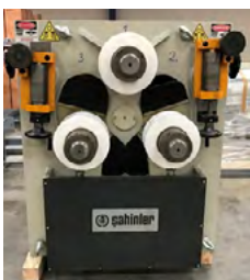
Sahinler profiljernsvale Type HPK 100 Digital udlæsning Pris DKK 175.000,-