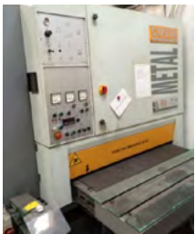
Costa afgratemaskine Type M60 CSS Max.slibebredde: 1150 mm Pris DKK 82.000,-