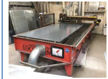
Lockformer plasmaskærer Type Vulcan NT2000 Bord: 1500x3000 mm Pris DKK 85.000,-