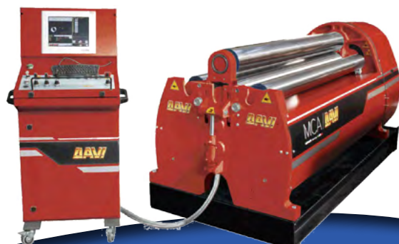
Davi MCA 20/17

MEBA båndsavene er af utrolig høj kvalitet med et unikt patenteret skruestiksystem, der sørger for at disse save kun mister begrænset kapacitet ved savning i smig. Savene er som standard udstyret med ledespindel til justering af skæreamens tilspændingshastighed, samt automatisk justering af snittryk. Hurtig sænkning af savearm til materialekant muligt via knapfunktion.