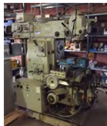
Stanko fræsemaskine Type 6P81 2000 omdr., ISO 40 Pris DKK 49.000,-