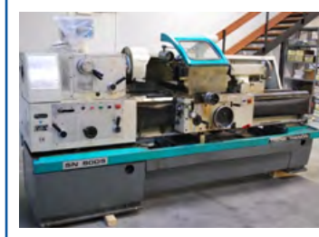
Trens drejbænk Type SN 500S Drejælængde: 1500 mm Pris DKK 65.000,-