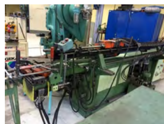
Bema semi-aut. rørbukker Type G1-A Kap. stål: 35x1,5, rustfri 26x2 Pris DKK 59.000,-