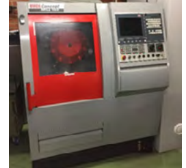
Emco bearbejdningscenter Type Concept Mill 155 X/Y/Z: 300x200x300 mm Pris DKK 95.000,-