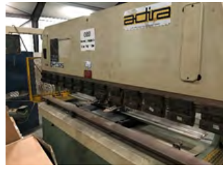
Adira kantpresse Type QH 6325 2500 x 63T, Cybelec cnc styring Pris DKK 49.000,-