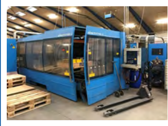
Prima laserskæremaskine Type Domino 1530 1500x3000 mm, Z-akse: 250 mm Pris DKK 295.000,-