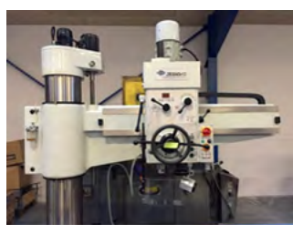
SIEG radialboremaskine Type ZB 3040x13 Borekap. 40 mm, MK4 Pris DKK 85.000,-