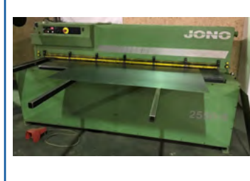
JONO maskinsaks Type 2550 x 6 mm Digital bagstop Pris DKK 59.000,-