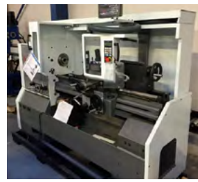
Pinacho drejbænk Type SC 200x1000 Drejælængde: 1000 mm Pris DKK 89.000,-