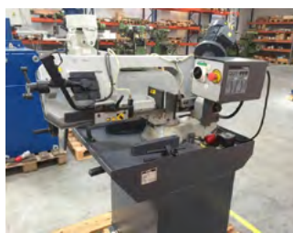
Pegas Gonda manuel båndsav Type MAN-R 220x250 Kap. 90°: Ø220/230x290 mm Pris DKK 15.000,-