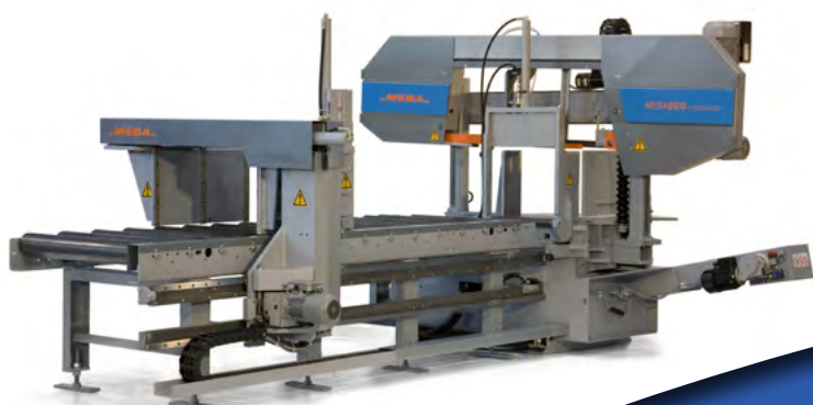
Meba ECO 335 DGA