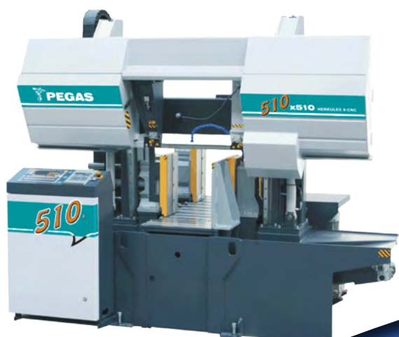
Herkules X-CNC 510 x 510