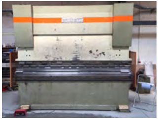
Donewell CNC kantpresse Type H150-3000 3000 x 20T, Cybelec styring Pris DKK 95.000,-