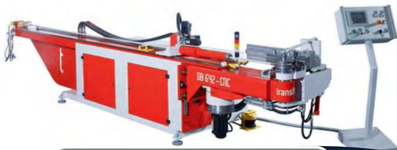
Transfluid DB 642-CNC

PEGAS GONDA båndsav type Herkules er en dobbeltsøjle båndsav, med komplet hydraulisk styring. Konstruktionen med dobbeltsøjle og lineære føringer, sikrer maksimal præcision og hastighed. Type Herkules er med fast 90 grader vinkel og derfor beregnet til vanskelige vertikale opgaver. Type SHI 400 er i semi-automatisk udførelse. Type S er designet med bevægeligt arbejdsbord.