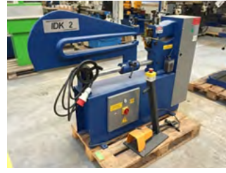
Sahinler rondelskærer, Demo Type IDK-2 Pladetykkelse: 2 mm Pris DKK 26.000,-