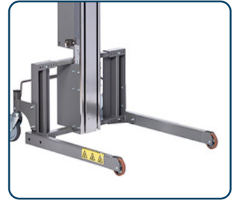
Flexi ben med fasta framhjul

Nedan visas bilder på några av de verktyg som går att använda med Impact 90