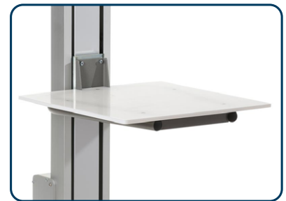
Lastbord i livsmedel godkänd PEHD plast