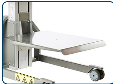
Lastbord rostfritt eller aluminium