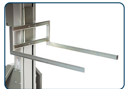
Gafflar fasta eller justerbara, finns även i rostfritt