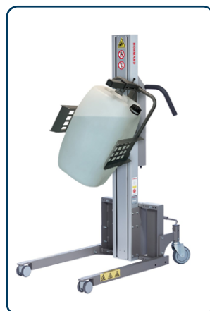
Impact 90 med dunkverktyg