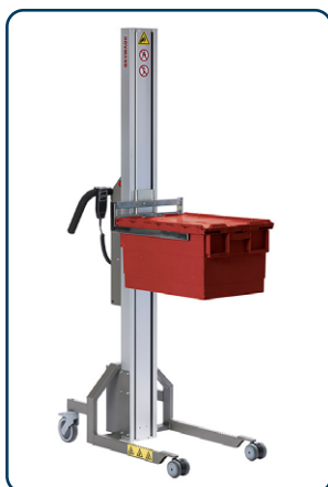
Impact 90 med gafflar

Vi tillverkar utöver detta även många kundspecifika verktyg. På andra sidan finns bilder på de verktyg som går att använda med Impact 90.