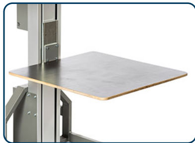
Lastbord i plywood, olika storlekar även med sidorullar

Nedan visas bilder på några av de verktyg som går att använda med Impact 90