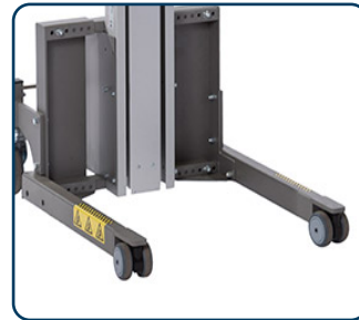
Flexi ben med svivlande framhjul