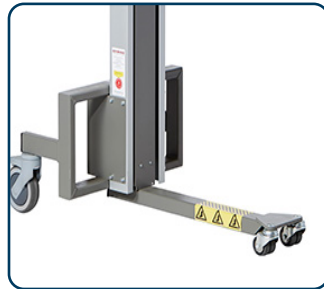
Center ben med svivlande framhjul