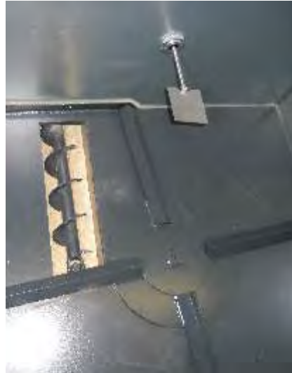
Rührwerk, Förderschneckenververdichter und Füllstandsmelder im Inneren Agitator, conveyor worm supercharger and level sensor inside