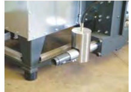
Transportrohr-Anschluss Transport pipe connection