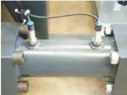
Verschleißfreie elektronische Sensoren Nonwearing electronic sensors