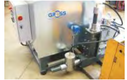
Einfacher Transport / Easy transport