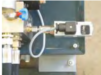
Einstellbarer Preßdruck Adjustable pressure