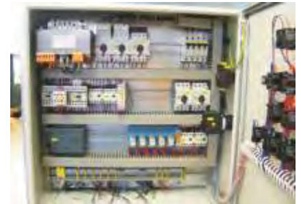
SPS-Steuerung / PLC-Control