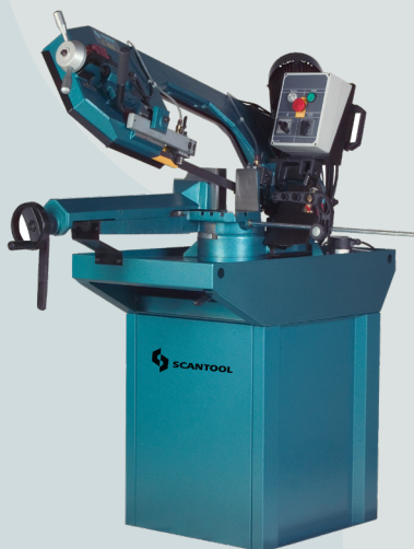
SCANTOOL 280 GSHT