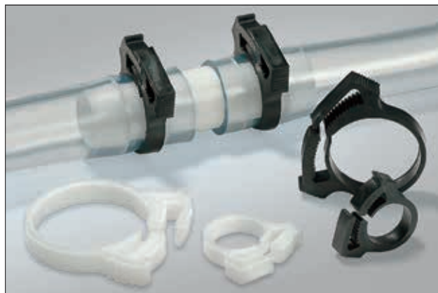
SNP serien af spændebånd.