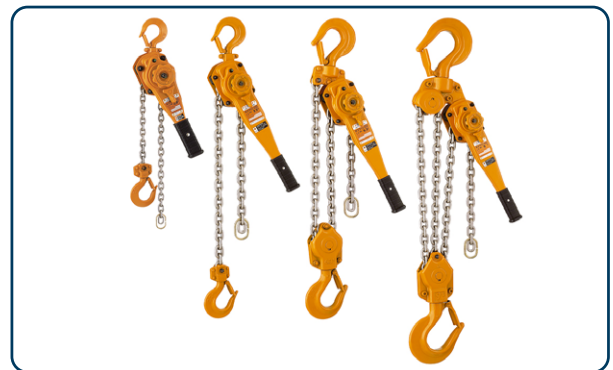
KITO LB i olika storlekar och kapaciteter