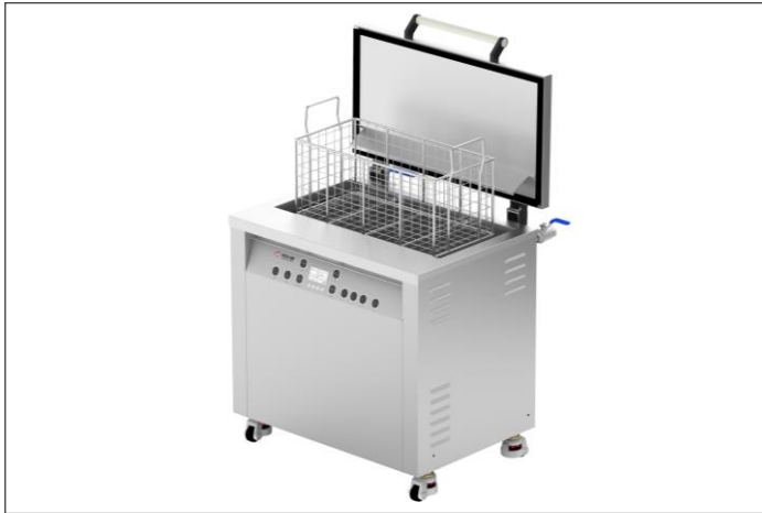
Standard Ultraljudsvätt 30-197L