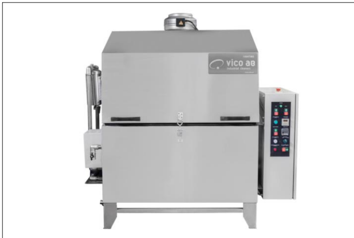
Spoltvätt Toppmatad & Snedskuren