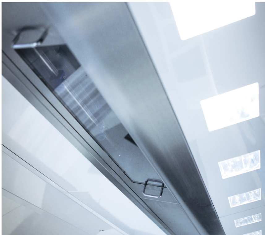
Udsugningskamre med kurver

Nyt design med Haltons Kulinariske Lys (HCL) og lavimpulserstatningsluft