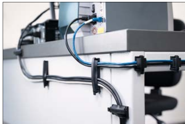
Perfekt løsning til føring af ledninger ved skrivebordet.