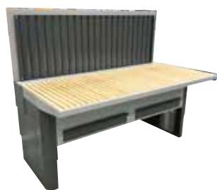
UFH-E-B Bagvæg med sug