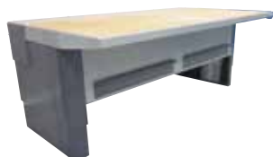
UFH-E Bordplade med sug

Kan leveres i følgende standardversioner: