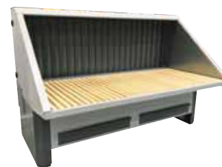
UFH-E-BS-ISO Bagvæg med sug samt loft og sider med lyd-isolering