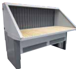
UFH-E-BS Bagvæg med sug samt loft og sider uden lyd-isolering