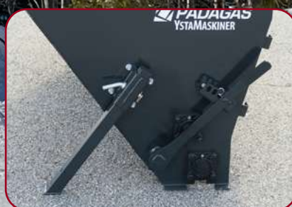
Stödben och reglering av utmatning