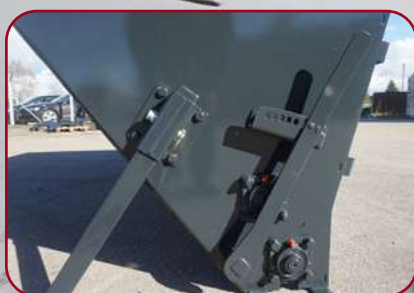
Stöbren och reglering av utmatning