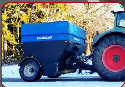
Blästrad, grundmålad och pulverlackerad