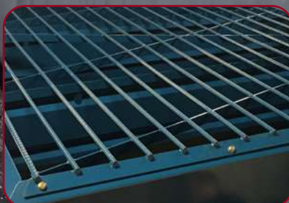
Galler som förhindrar klumpar vid påfyllning