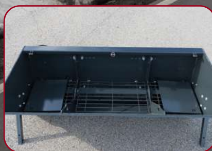
Öppningsbara skyddsgaller och spidarregleringsplåtar