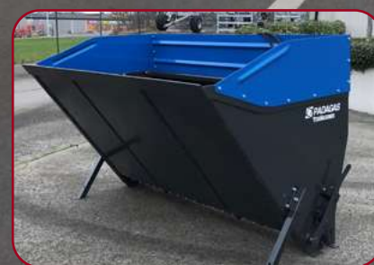
Förhöjningssidor SP 3000