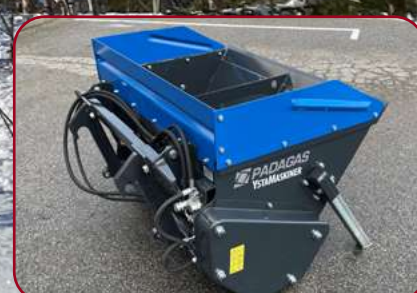
Förhöjningssidor SP 600