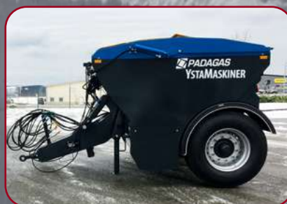
Fjädrat drag med ackumulator