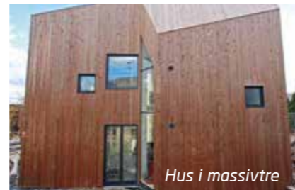
Hus i massivtre