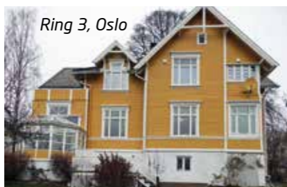
Ring 3, Oslo

Se flere referanser på www.lavenergisystemer.no