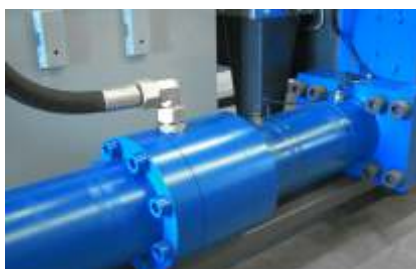
Starke Verpressung durch großzügig dimensionierte Zylinder