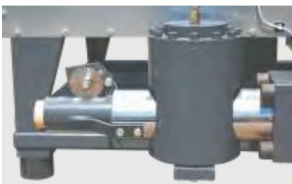
Stranglängenüberwachung zur automatischen Brikettierlängenregulierung