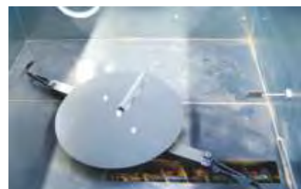
Robustes Rührwerk, Austragarme mit Federmechanismus, Schneckenvorverdichtung