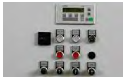
Übersichtliche Bedienung mit Handfunktionen. Optional mit Klartextdisplay