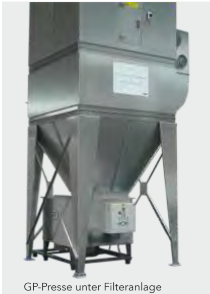
GP-Pressen unter Filteranlage