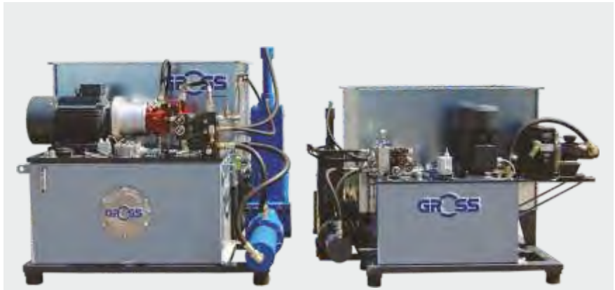
Rechts- und Linksausführung der Presseneinheit

Die GP-Serie ist deshalb die erste Wahl für die Holzverarbeitende Industrie.