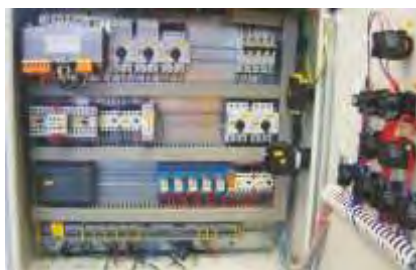
Schaltschrank / SPS-Steuerung