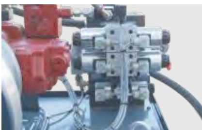
Solide Ventil und Pumpentechnik