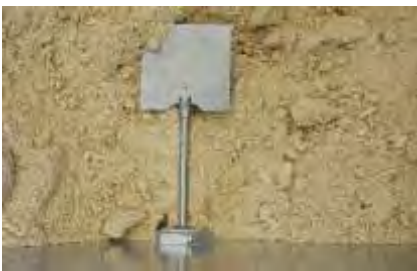
Optional: Füllstandsmelder für automatischen Start der Maschine