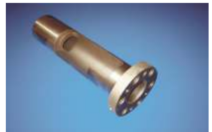
Auswechselbare durchgängig gehärtete Preßraum-Verschleißbuchse