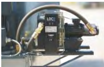
Optional: Ölkühlung für Hydraulikaggregat