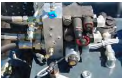
Sensor für Öltemperatur Optional: Ölmangelschalter