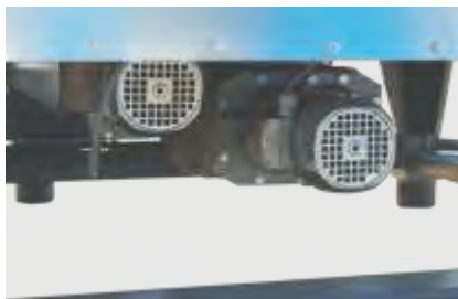
Starke Getriebemotoren für Schnecken- vorverdichtung und Rührwerk