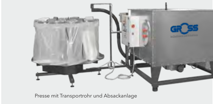
Pressen mit Transportrohr und Absackanlage