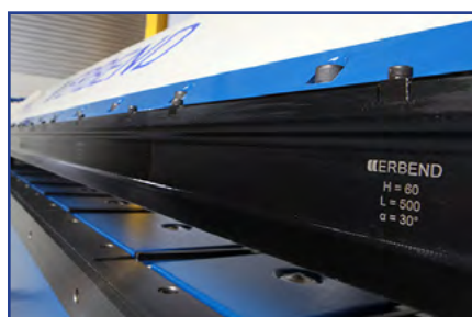
Gedefodssegment 60 mm