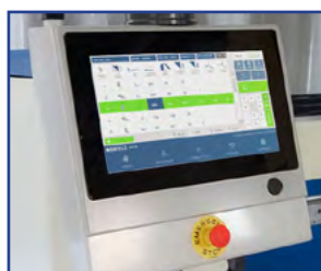
Erbend 2D / 3D CNC styring

ERFOLD ADVANCED cnc grafisk software specifikt designet til ERBEND mot. bukkemaskiner med adskillige løsninger og betjeningsvenlig interface til alle typer bukninger. 15.6" el. 22" touchscreen all-in one industriel pc styring på svingarm. 16 GB hard disk plads gør at du kan lagre ubegrænset antal jobs eller værktøjsdata.