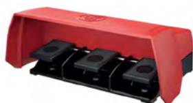
Fodpedal med 3 kontakter