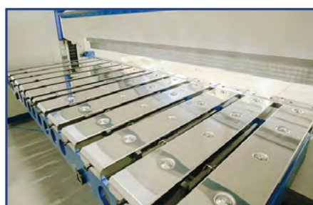
Beskyttelse i rustfrit stål til pladeanslag

2 motorer på overvangen med kuglespindler for højere tryk