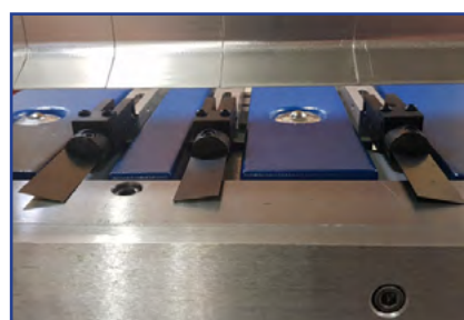
Massiv undervange & fjederfingre på bagstoppet