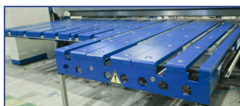
L-formet pladeanslag (metal el. børster)