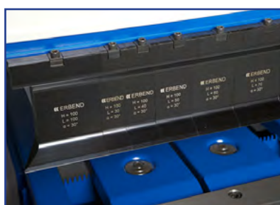
Gedefodssegment 90 mm

ERFOLD ADVANCED cnc grafisk software specifikt designet til ERBEND mot. bukkemaskiner med adskillige løsninger og betjeningsvenlig interface til alle typer bukninger. 15.6" el. 22" touchscreen all-in one industriel pc styring på svingarm. 16 GB hard disk plads gør at du kan lagre ubegrænset antal jobs eller værktøjsdata.