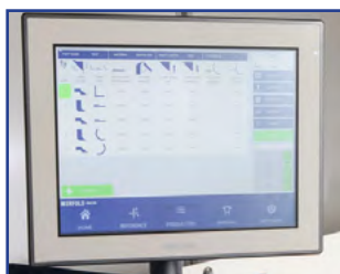
Erfold basic CNC styring