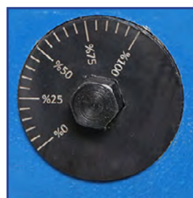
Manuel just. bombing