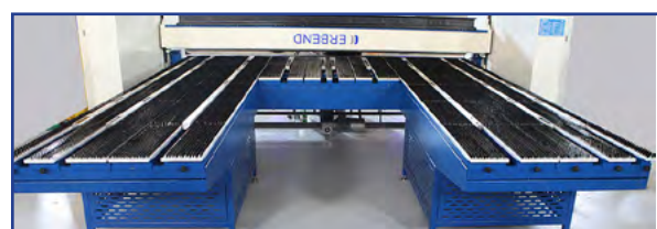
U-formet pladeanslag (metal el. børster)