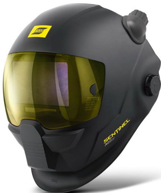
Sentinel A60 Air