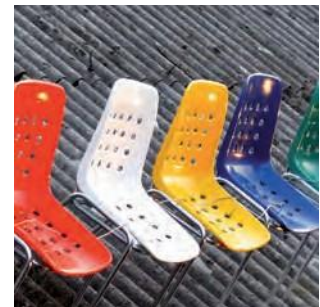
Plast / GRP