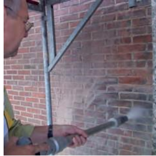
Murstein / fasader