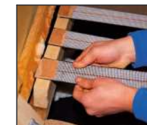
Reparation / montage