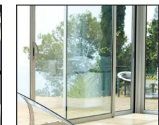
Træ / aluminium vindues konstruktion