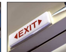
Montering af skilte