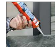
Behandling af natur sten