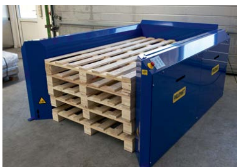
2015x900x137 mm paller

Kontakt din forhandler og lad dem finde PALOMAT® - løsningen til netop dit palleflow