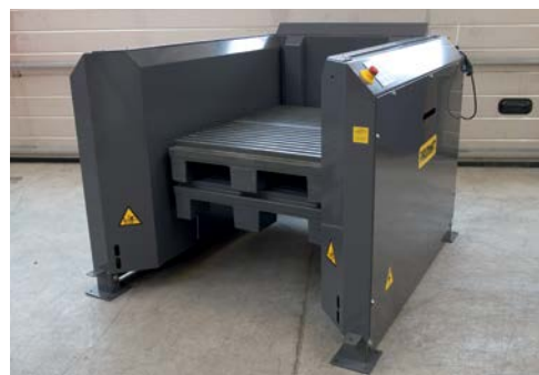
1060x750x175 mm paller

Virksomheder som Grundfos, Carlsberg, Coca Cola, Volvo, Nestlé, Chanel, Haribo, Pfizer, Siemens og Miele bruger allerede PALOMAT® til at effektivisere deres palleflow.