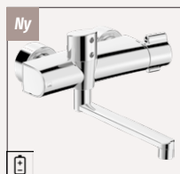
Oras Clinica 5672 U Håndvaskarmatur | Berøringsfri / Termostatisk | Vægmonteret Krom