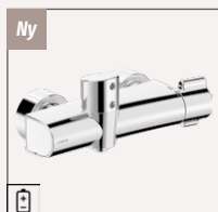
Oras Clinica 5670 U Bruserarmatur | Berøringsfri / Termostatisk | Vægmonteret Krom