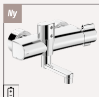
Oras Clinica 5671 U Håndvaskarmatur | Berøringsfri / Termostatisk | Vægmonteret Krom