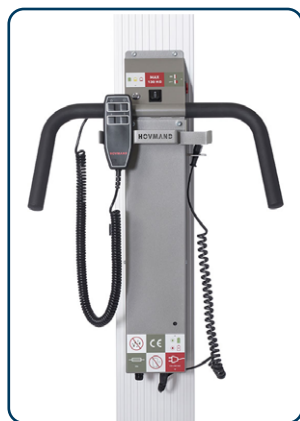
Impact 130 handtag