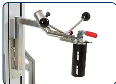
Rullexpander för att lyfta och rotera rullen 90°