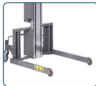
Flexi ben med fasta framhjul

Nedan visas bilder på några av de verktyg som går att använda med Impact 130