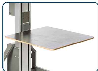
Lastbord i plywood, olika storlekar även med sidorullar

Nedan visas bilder på några av de verktyg som går att använda med Impact 130