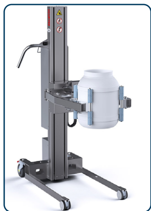
Impact 130 med klämverktyg

Impact 130 kan anpassas efter dina specifika behov med fem masthöjder kombinerade bentyper i olika längder och med olika hjulalternativ. Dessutom finns ett stort antal standardverktyg som tex lastbord, gafflar, spjut, pikbom, klämverktyg och expandrar med 90° för rullar till storsäljaren Impact 130 lyftvagn. Det finns även drivna klämverktyg med tilt eller vridning för rullar, tunnor, fat mm. Till Impact 130 finns också expander med driven tiltrörelse för rullar från liggande till stående eller tvärtom.