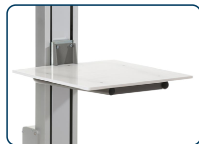
Lastbord i livsmedel godkänd PEHD plast