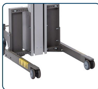
Flexi ben med svivande framhjul