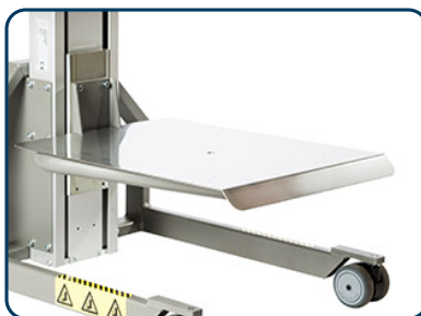
Lastbord rostfritt eller aluminium