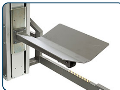
Lastbord för liggande rullar