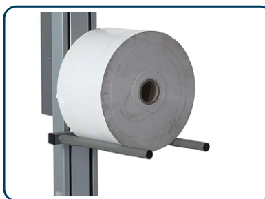
Pikbom enkel eller dubbel