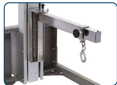
Kranarmar i rostfritt