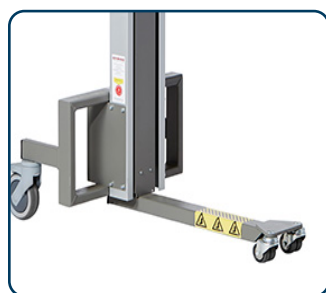
Center ben med svivande framhjul